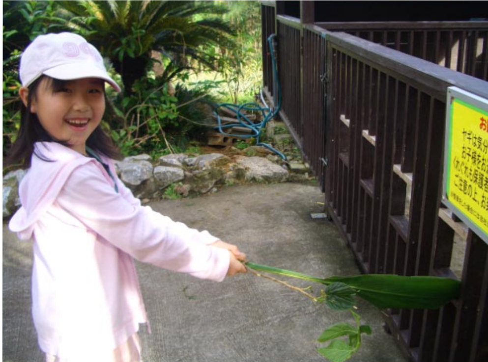
にっこりえさあげてたら、すごい力でヤギに食べられた～ (・д・;)