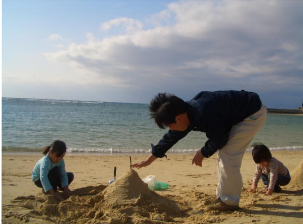
トンネルトンネル♪作ってみました