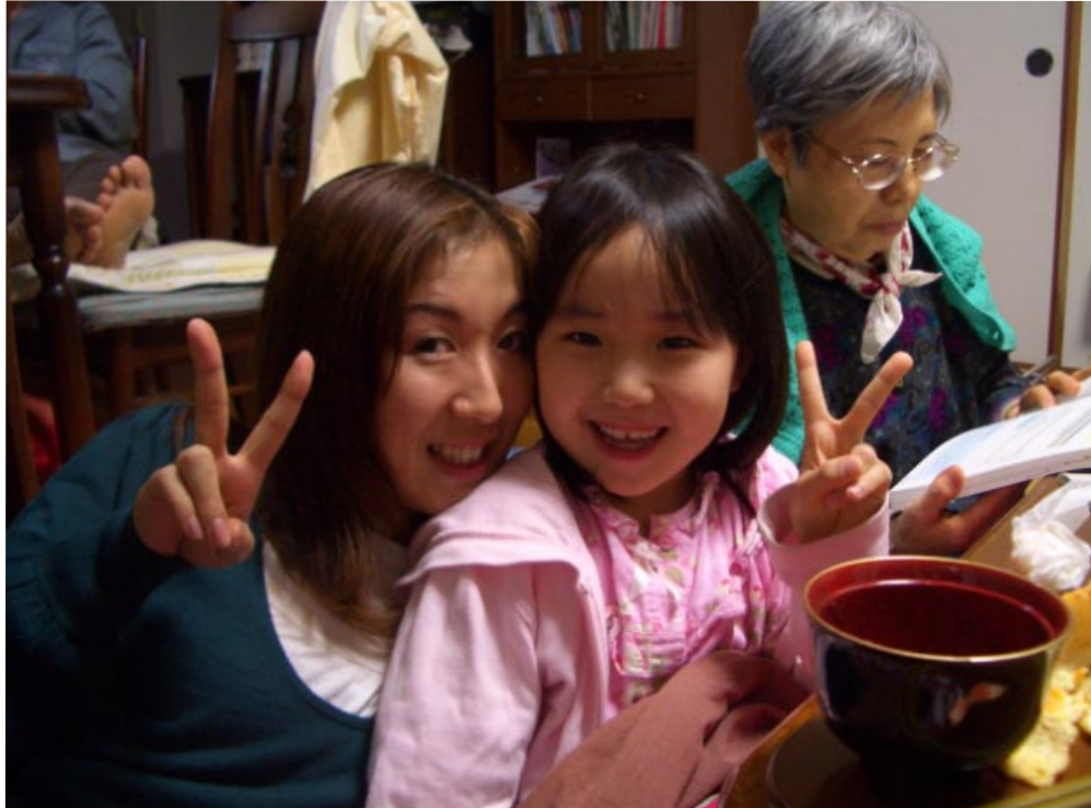
まりちゃんが来てくれました！