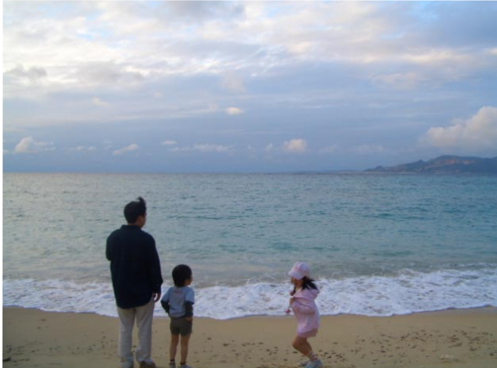
帰り、恩納村のビーチによりました