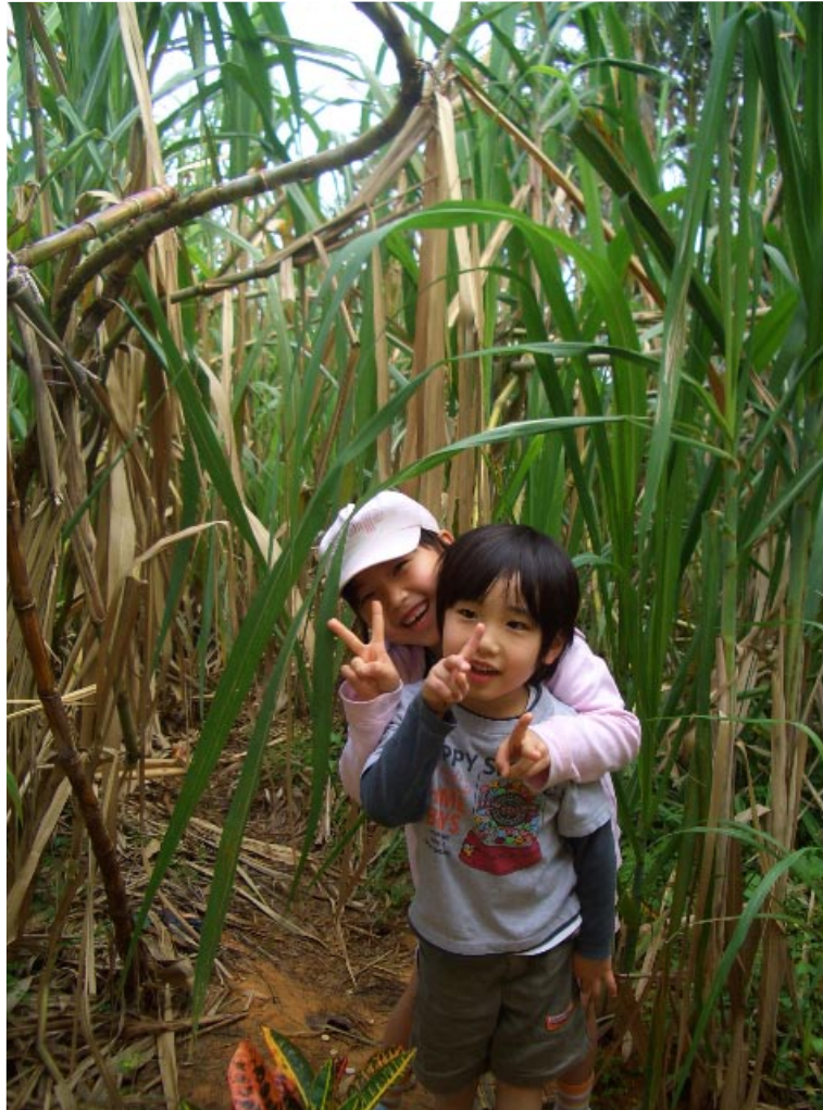
サトウキビ畑で二人でピース♪