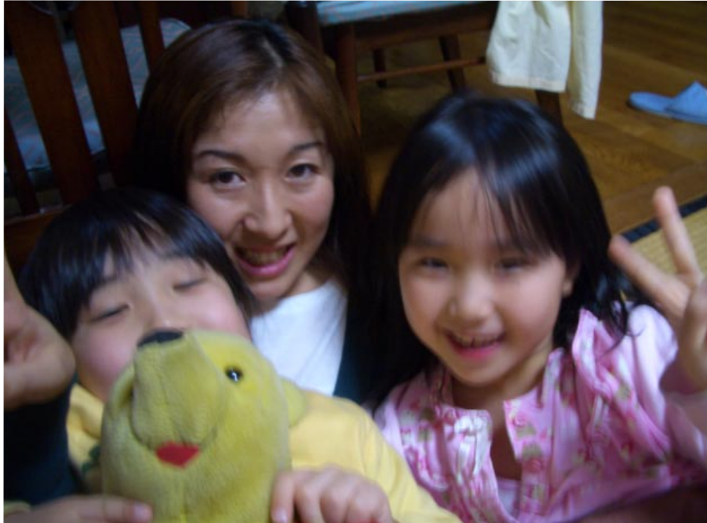
四人で、はいチーズ♪