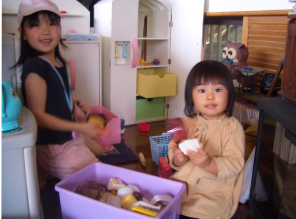
さやちゃんのいとこのはなちゃん♪