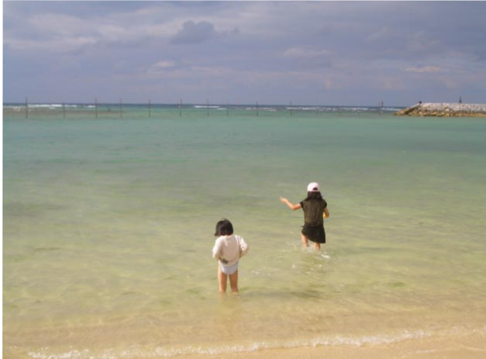
サンセットビーチ ♪