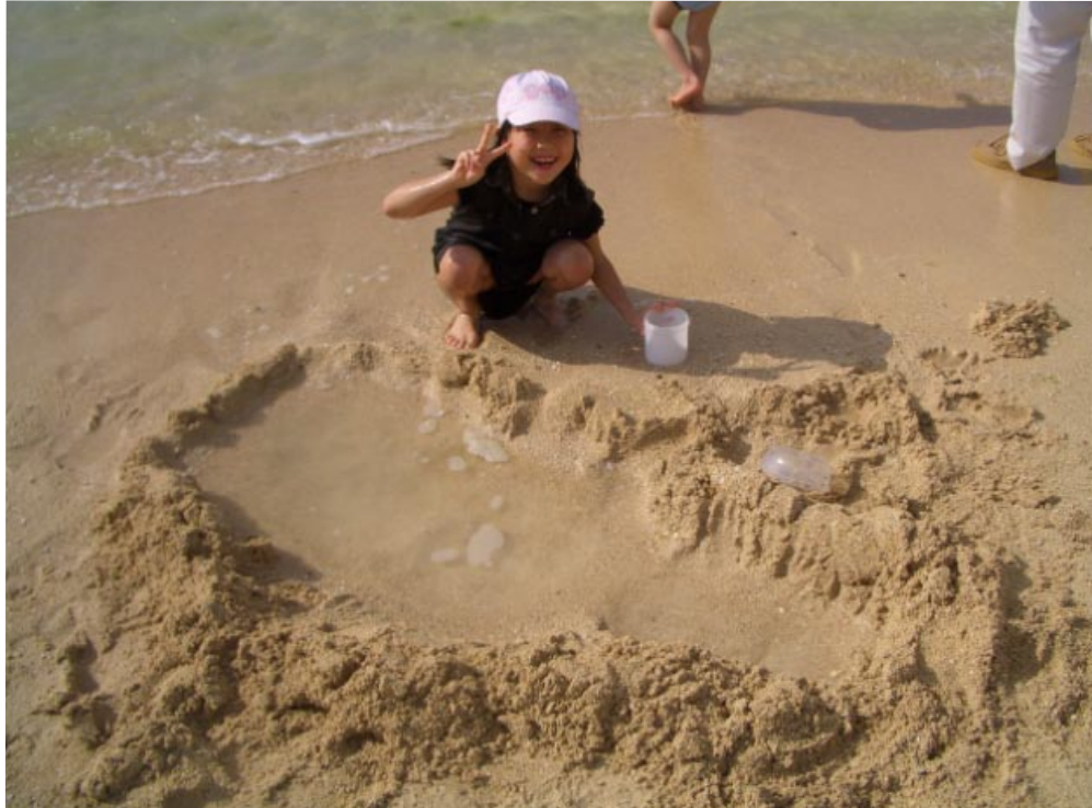
みずたまりを作ったよ (^ 0 ^)