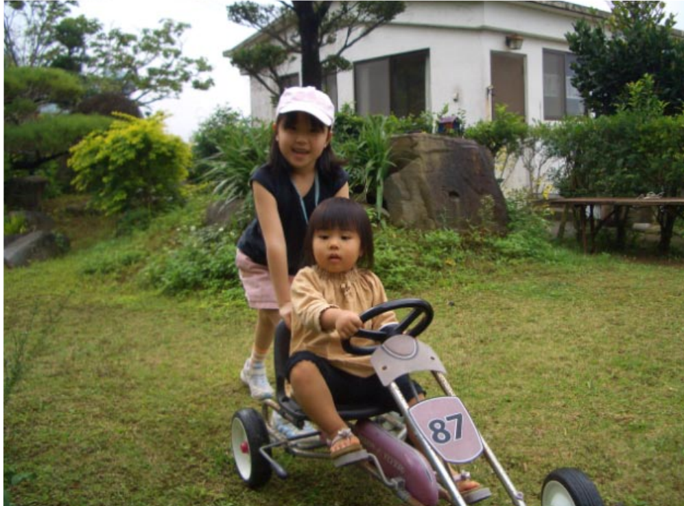
お姉ちゃん振りを発揮！！